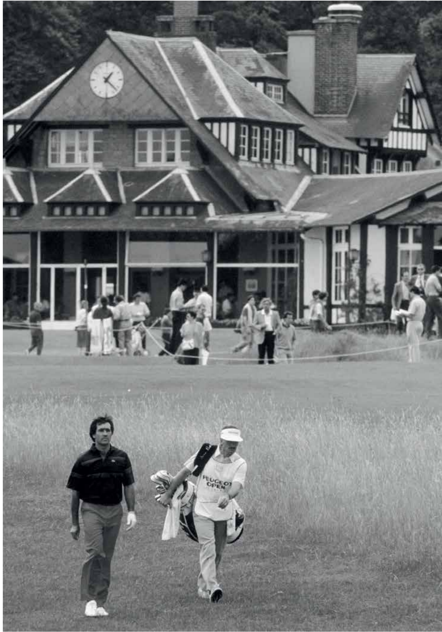
Severiano Ballesteros avec en toile de fond le club-house, lors de l'open de France 1988