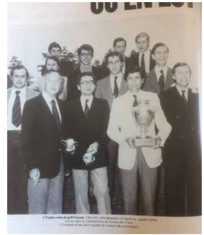
L'équipe de Chantilly, vainqueur de la Gounouilhou 1985

Un parcours façonné par un architecte aussi mythique que les lieux, Tom Simpson. Si les greens sont bien défendus par des bunkers, à Chantilly comme sur tous les tracés signés de l'Anglais, vous ne trouverez jamais d'obstacle frontal. Une aubaine pour les amateurs de tops ou de grattes. —>