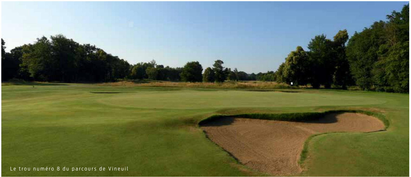
Le trou numéro 8 du parcours de Vineuil