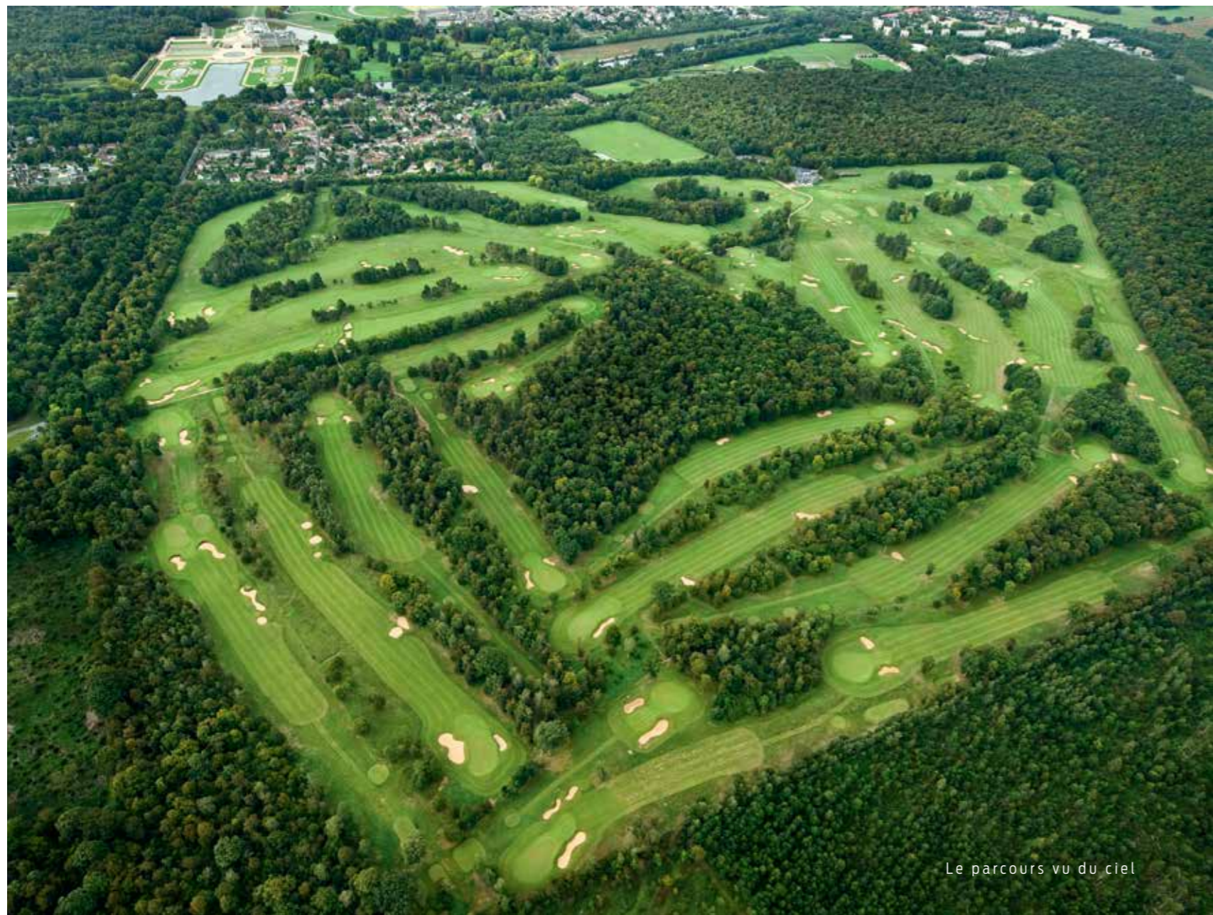
Le parcours vu du ciel