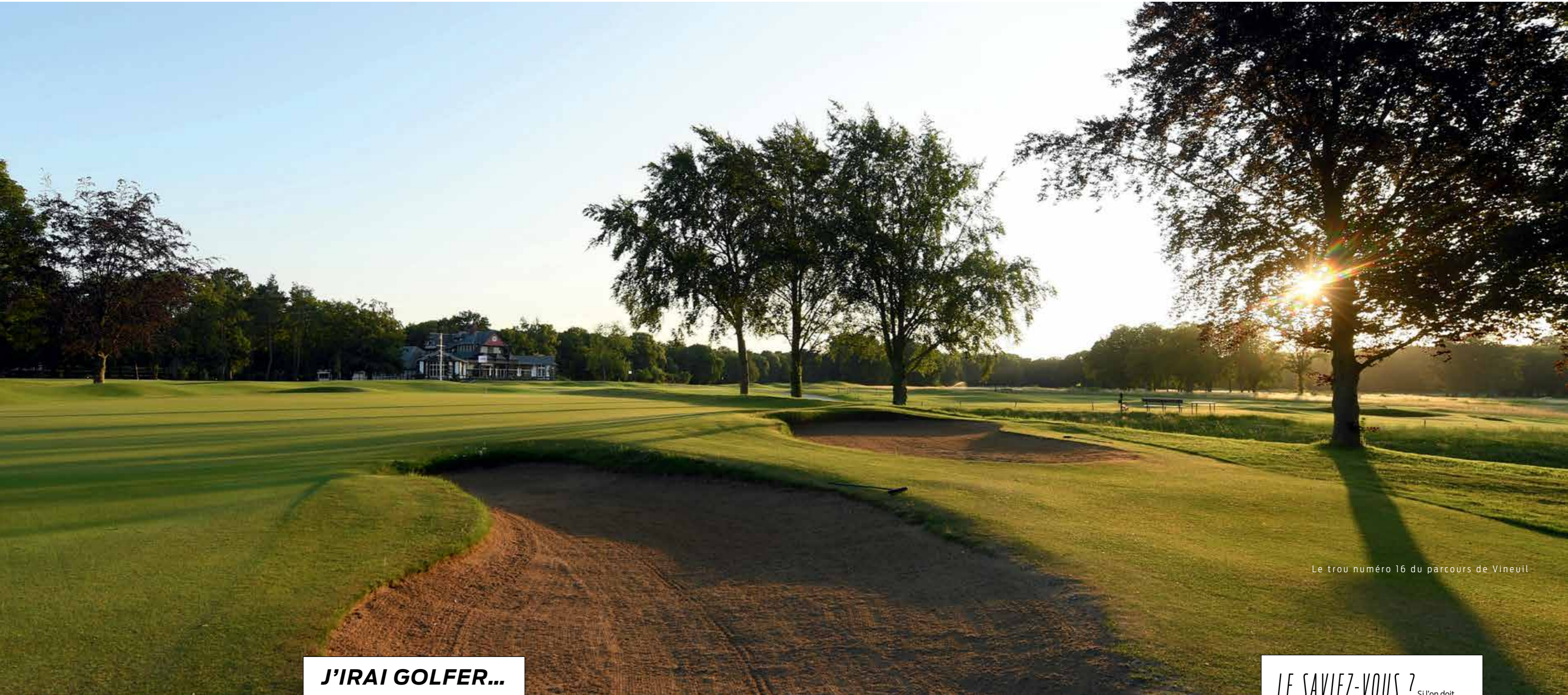
Le trou numéro 16 du parcours de Vineuil